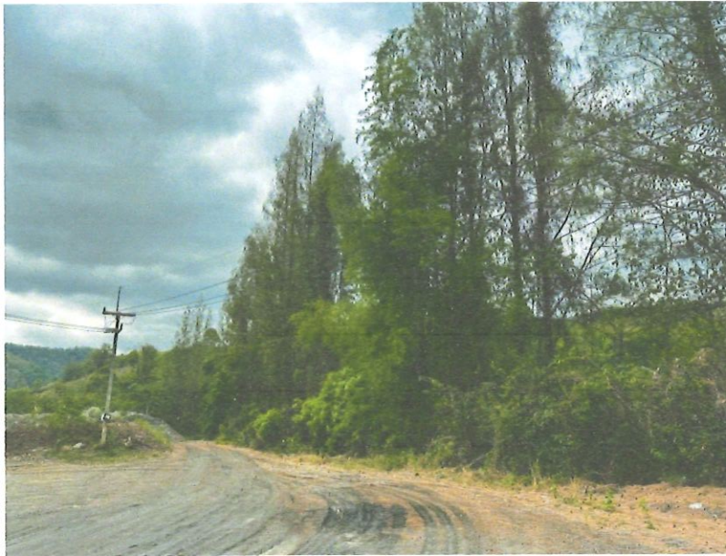
รูปที่ 1-8 พื้นที่เว้นแนวเขต 50 เมตร ไม่ทำเหมือง