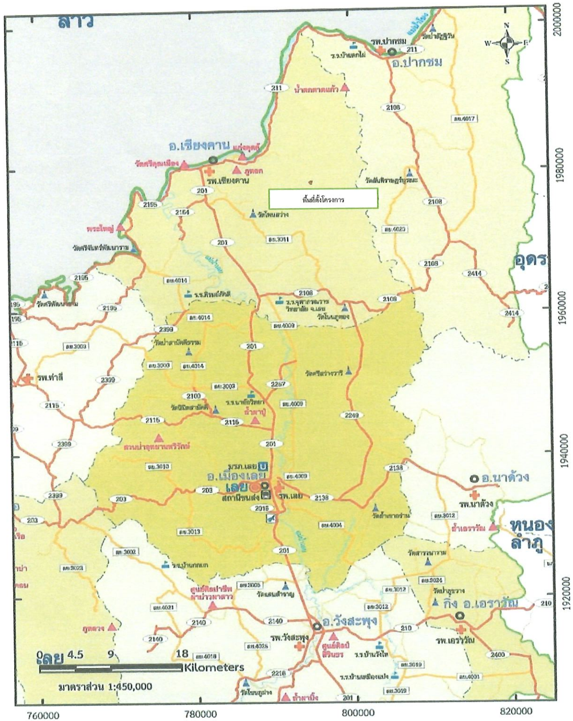
รูปที่ 1-2 เส้นทางคมนาคมและพื้นที่ตั้งโครงการ ตามประทานบัตรที่ 27164/15740