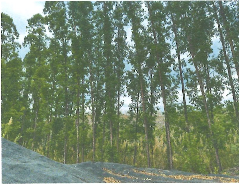
รูปที่ 1-10 แนวปลูกต้นไม้ตลอดแนวเขตเหมืองแร่