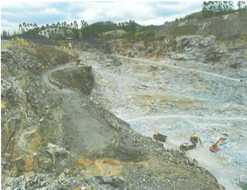
รูปที่ 1-6 สภาพบ่อเหมืองปัจจุบัน