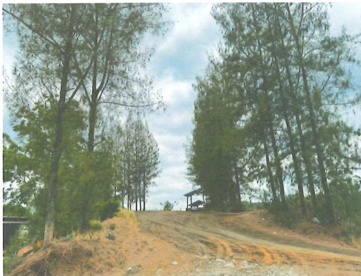
รูปที่ 1-9 แนวปลูกต้นไม้ รอบพื้นที่โรงแต่งแร่