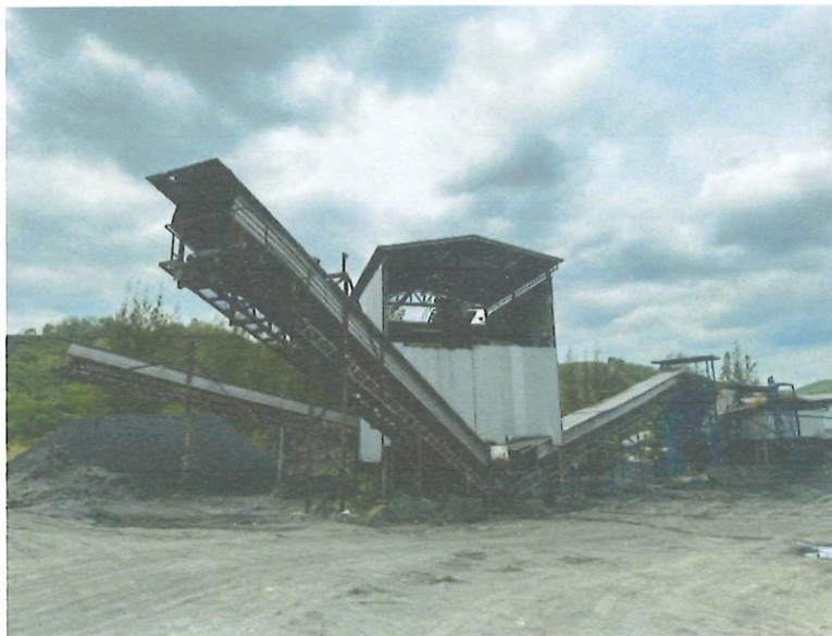
รูปที่ 1-7 โรงแต่งแร่