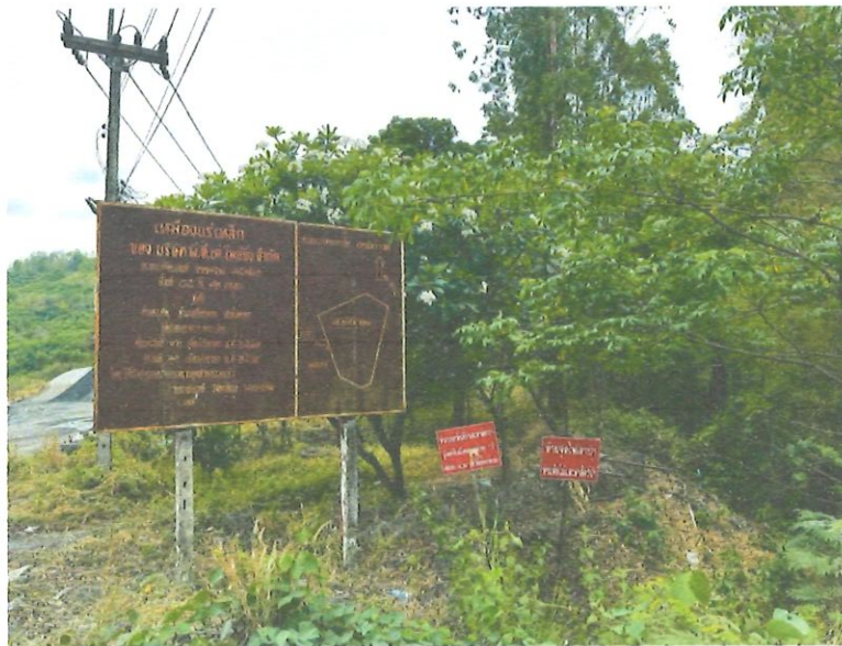
รูปที่ 1-11 ป้ายแสดงพื้นที่โครงการเหมืองแร่ ชนิดแร่เหล็ก บริษัท พี.ที.เค.ไมน์นิ่ง จำกัด